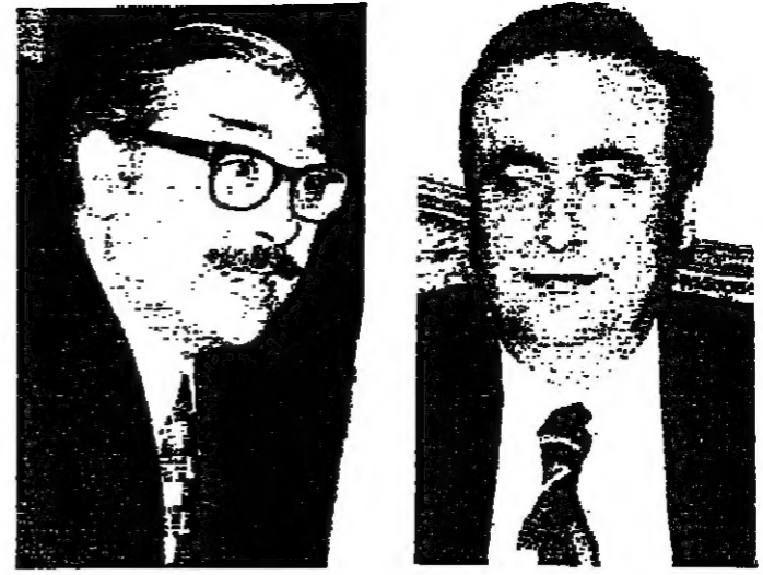
وزير المال خالد جنبلاط

كتب عامر مشومسي : مساهم الزيادة المضي ، أصدر مجلس الوزراء المرسوم رقم 1178